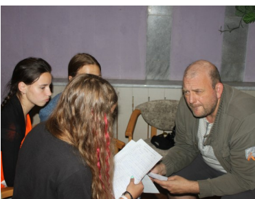
Идут переговоры с иностранным критиком