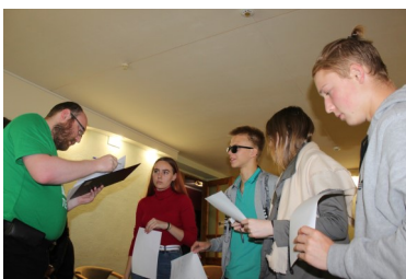
Утверждается репертуар театра