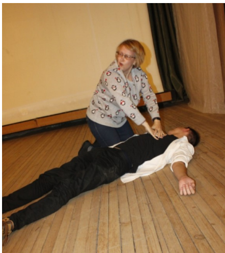
Не переживайте, никто не пострадал, просто это одна из сценок. «Откачивать» от смеха надо было