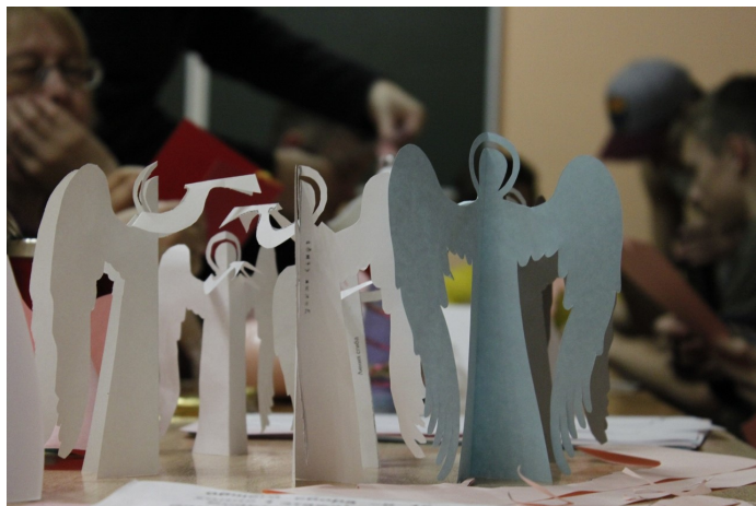
А в лагере было много-много ангелочков. Вот таких милых созданий сделали участники лагеря Секретные материалы» на рождественских мастер-классах и развезли по домам. До новой встречи!