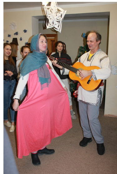
Колледжане колядовали, а преподаватели, как и положено, раздавали им сладости.