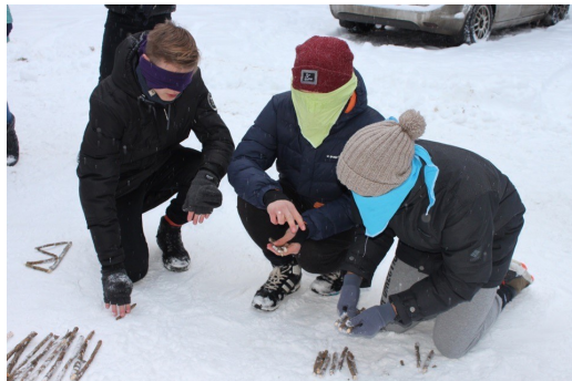
Ребята составляют слово «Вечность» на очередном этапе в «Погоне за кладом»

Мастера стратегической игры могли подсказать ребятам следующий ход, а также выдавали букву для выполнения финального задания игры.