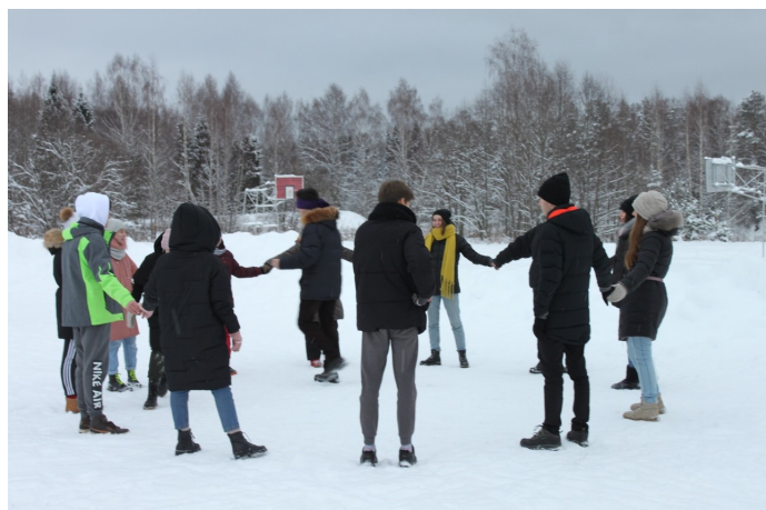
Сказочная погода позволила провести много времени на свежем воздухе в окружении заснеженного соснового бора