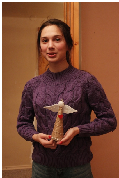
Мастер-класс в преддверии Рождества по изготовлению сердечного ангела прошел успешно: идею подсказали родители, провели учителя, все ушли с подарочками, главное – счастливые!