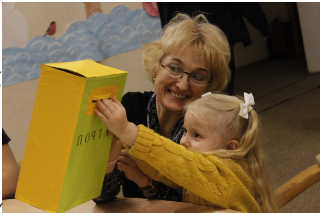
Ольга Германовна выращивает следующее поколение колледжан. Будущее — в надежных руках!