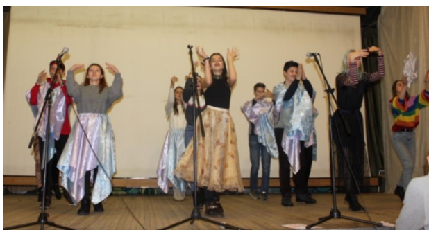
Отряд «Эркюль Пуаро» показывает сцену в жанре Индийского кино по мотивам повести «Собака Баскервилей»