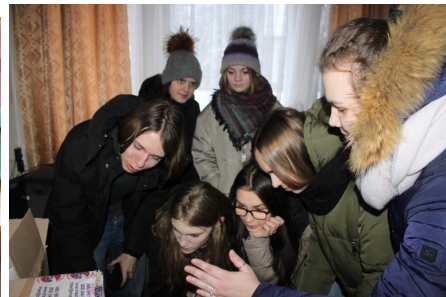
В игре «Похищение куратора» отряд Огюст Дюпен составляет портрет своего куратора