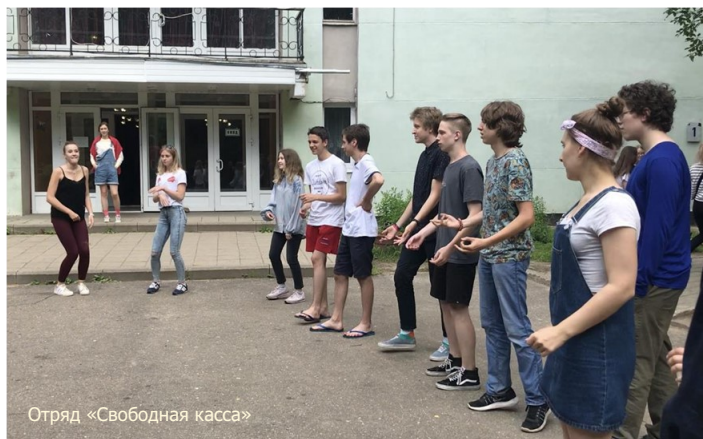
Отряд «Свободная касса»

Для нас свобода - это использование способности к созданию и творению в дозволенной мере. Грани свободы являются предметом долгих философских дискуссий. Наш отряд тоже не пришел к консенсусу в этом вопросе, а поэтому выразился словами Бориса Моисеева, который в песне Sexual Revolution сказал: «Только не во вред другим».