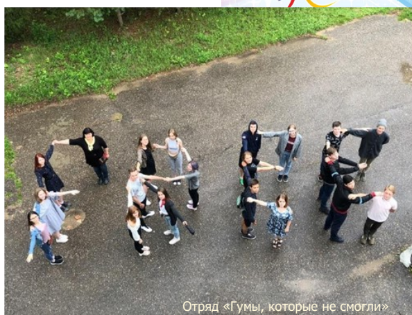
Отряд «Гумы, которые не смогли»

Говорить на тему свободы в сугубо женском отряде достаточно сложно, но поэтому и интересно. Первое, что приходит в голову, это свобода поведения. Например, есть, когда хочется, одеваться, как хочешь, - в общем, делать все, как тебе нравится. Эти действия часто ограничиваются менталитетом, предрассудками, общественным мнением. И поэтому свобода человеческих действий должна исходить из свободы его мышления. Но всегда надо помнить: наша свобода заканчивается там, где начинается свобода другого.