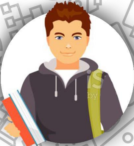
Сын (близнец) Сартр