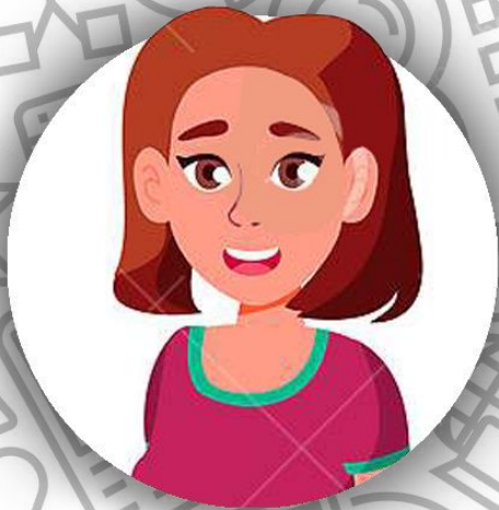
Младшая дочь Кокто