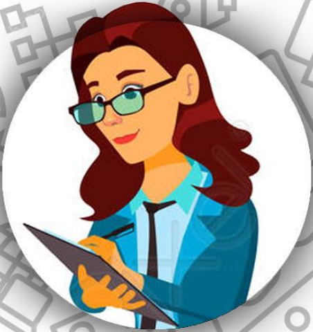
Бухгалтер (семья Сартр)