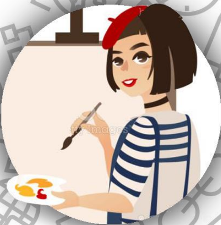
Художник (семья Феллини)