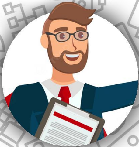
Юрист (семья Феллини)