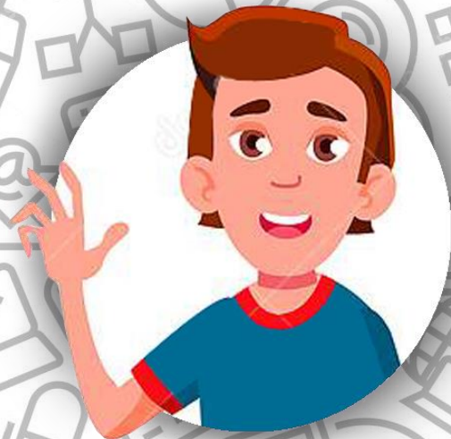
Младший сын Борхес