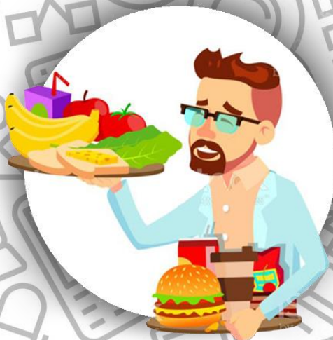
Диетолог (семья Бодлер)