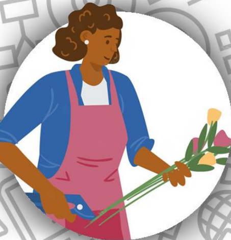
Флорист (семья Бодлер)