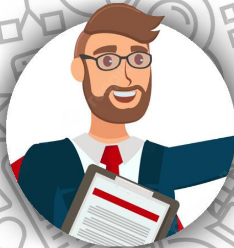
Юрист (семья Бодлер)