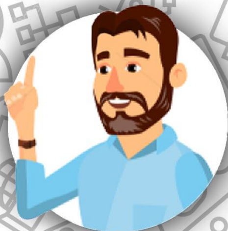
Босс - глава семьи ФЕЛЛИНИ