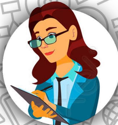
Бухгалтер (семья Бодлер)