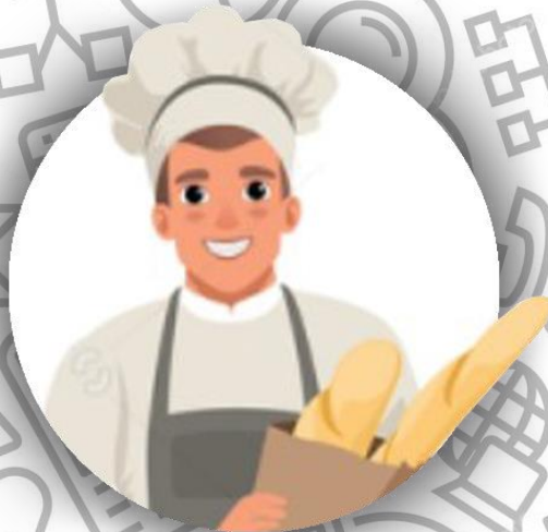
Пекарь (семья Гринуэй)