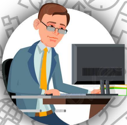
Контент-менеджер (семья Сартр)