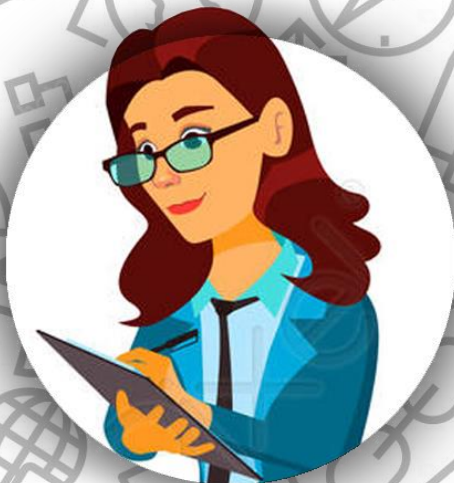
Бухгалтер (семья Линч)