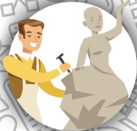
Скульптор (семья Гринуэй)