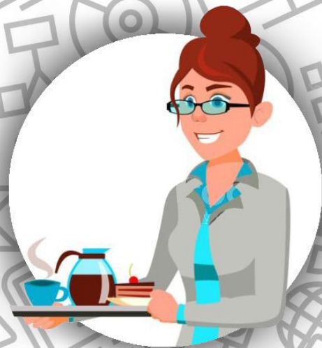
Секретарь (семья Альмодовар)