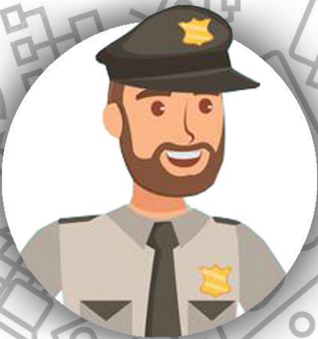
Начальник службы безопасности (семья Гиллиам)