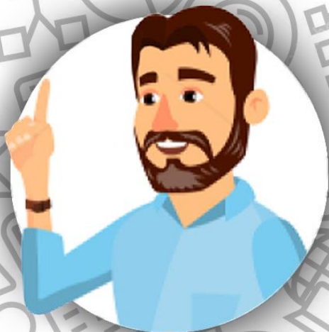
Босс - глава семьи Альмодовар