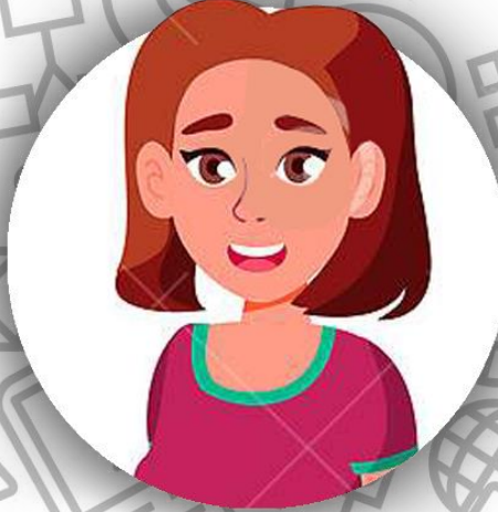
Младшая дочь Бодлер