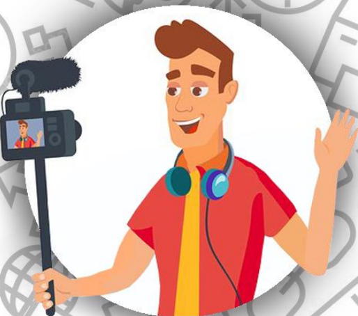
Блогер (семья Линч)