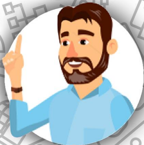
Босс - глава семьи Гиллиам