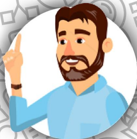
Босс - глава семьи Кокто