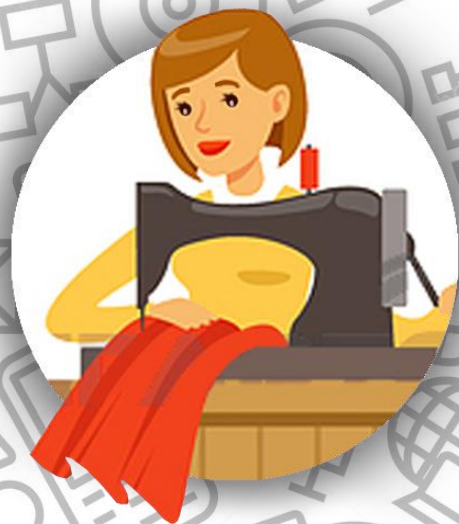
Портной (семья Альмодовар)