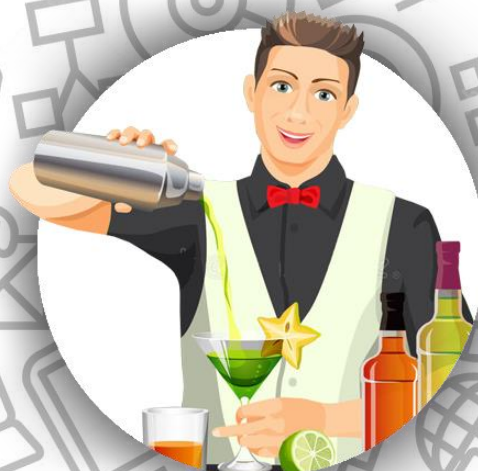
Владелец бара и бармен (семья Бодлер)