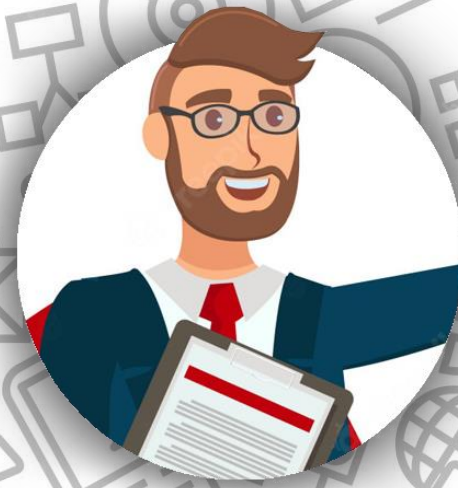
Юрист (семья Кокто)