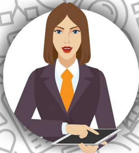
Страховой агент (семья Кокто)