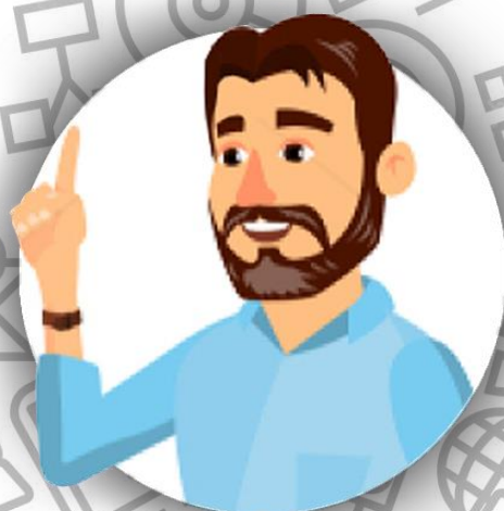
Босс - глава семьи Гринуэй