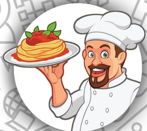
Повар (семья Сартр)