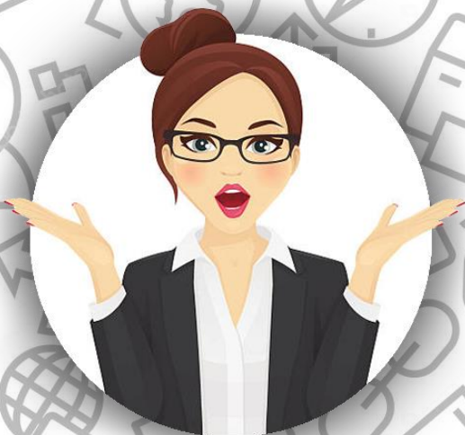
Социолог (семья Феллини)