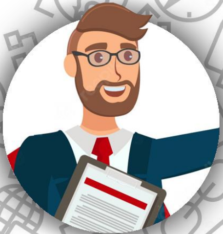
Юрист (семья Линч)