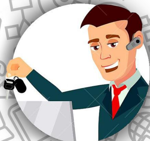
Бизнесмен (семья Кокто)