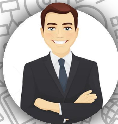
Дипломат (семья Кокто)