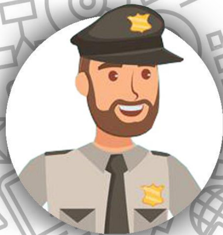
Начальник службы безопасности (семья Гринуэй)