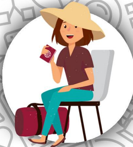
Агент по туризму (семья Кокто)