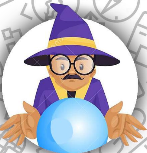
Астролог (семья Гиллиам)