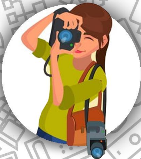
Фотограф (семья Сартр)