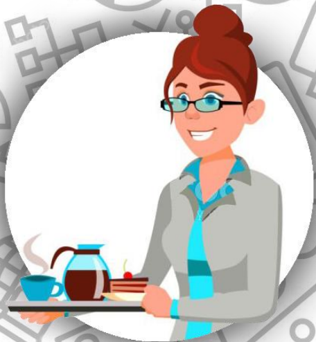
Секретарь (семья Джойс)