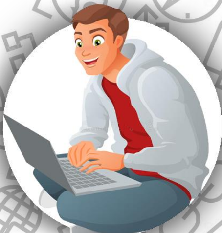
HTML-верстальщик (семья Джойс)