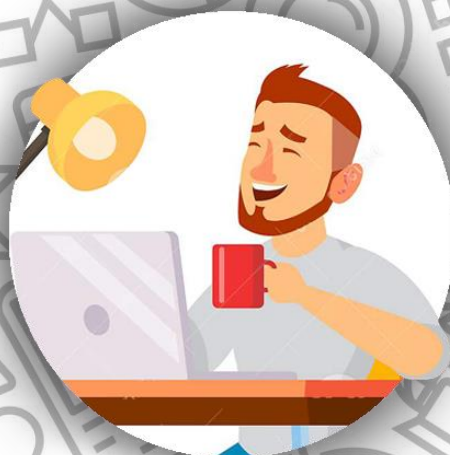
Дизайнер интерьера (семья Борхес)