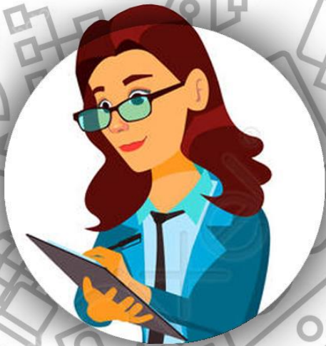
Бухгалтер (семья Гиллиам)