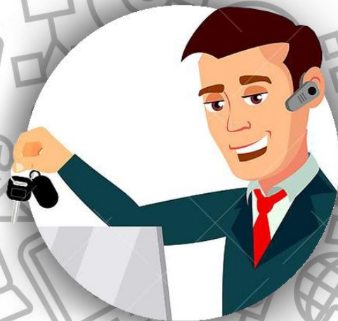
Бизнесмен (семья Борхес)