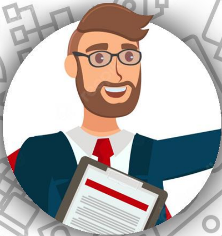
Юрист (семья Джойс)