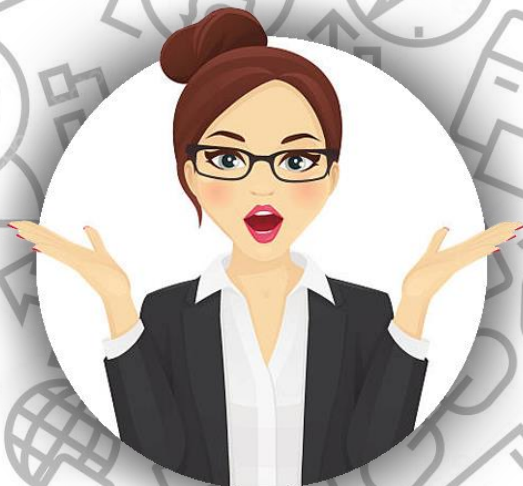
Социолог (семья Гиллиам)