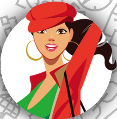
Дизайнер одежды (семья Гиллиам)