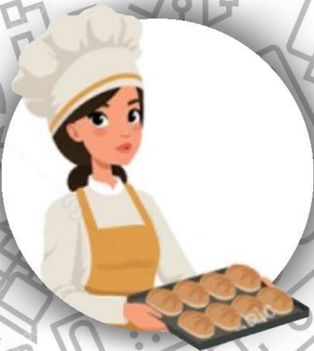
Кондитер (семья Линч)