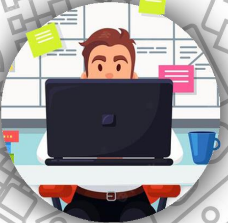
Транспортный планировщик (семья Феллини)