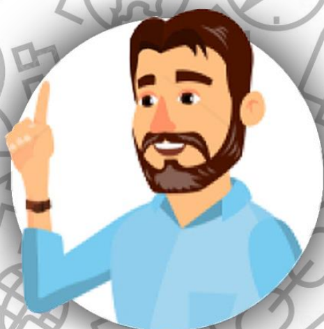
Босс - глава семьи Линч