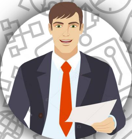
Байер (семья Линч)