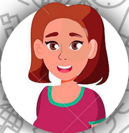
Младшая дочь Джойс