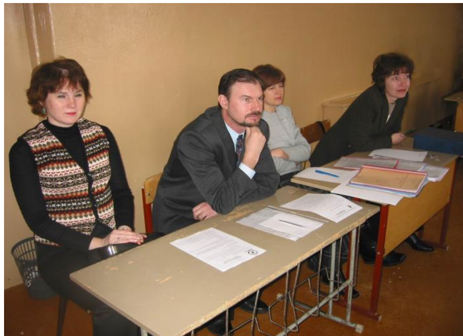
Работа секций городского этапа научной конференции школьников «Открытие»