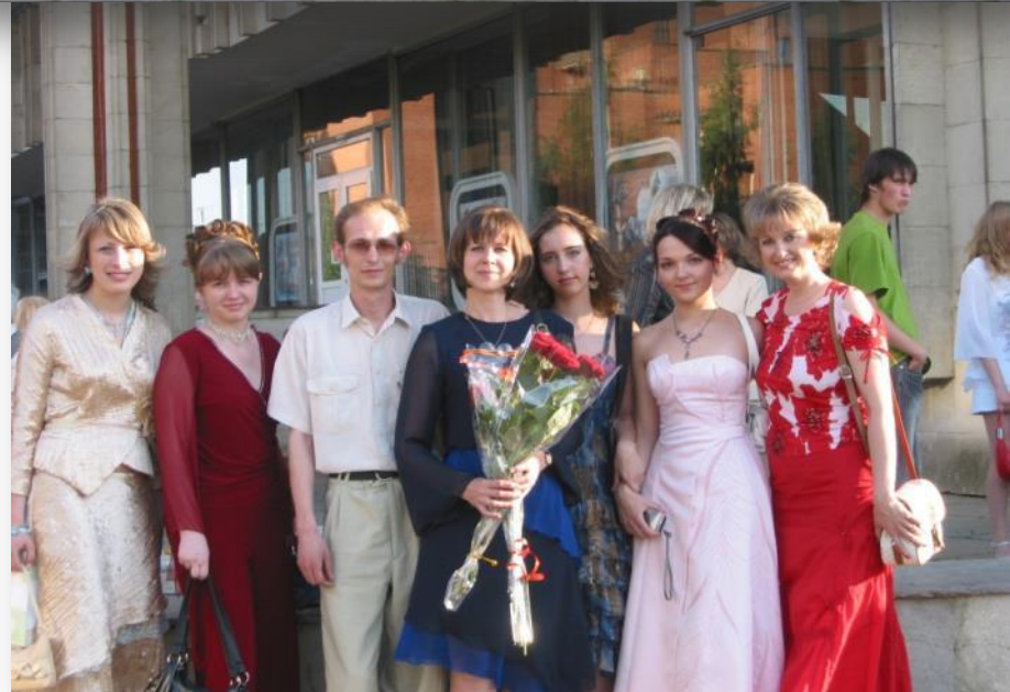
На фото: выпускники 2005 г. и педагоги «Провинциального колледжа»