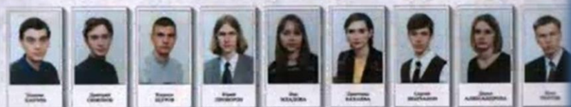
ВЫПУСК ЭКОНОМИЧЕСКОГО КЛАССА