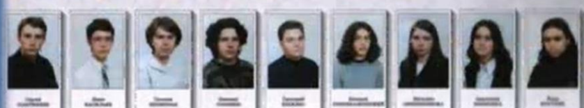
ВЫПУСК ГУМАНИТАРНОГО КЛАССА