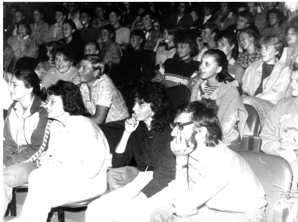
Летний лагерь 1992 г. (база «Приморский хуторок», Рыбинский район)