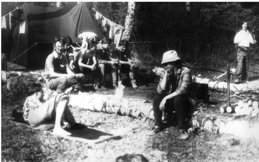
Поход по р.Которосль, 1992 г. (Гаврилов-Ямский район Ярославской области).

Ученики ходили в походы, ездили в лагерь